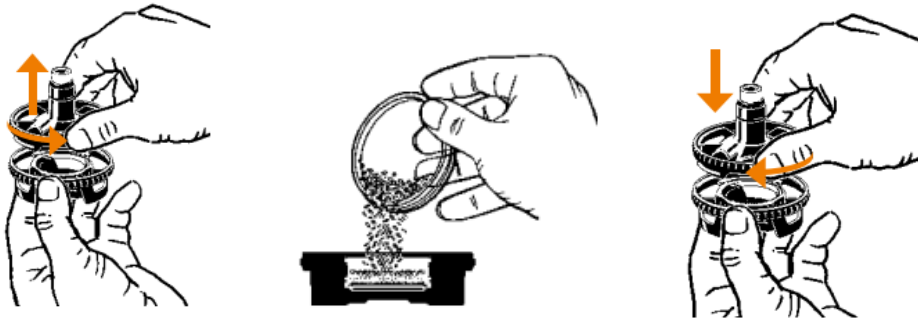
ΑΦΑΙΡΕΣΗ ΤΟΥ ΚΑΠΑΚΙΟΥ ΑΠΟ ΤΟΝ ΘΑΛΑΜΟ ΠΛΗΡΩΣΗΣ, ΠΛΗΡΩΣΗ ΤΟΥ ΘΑΛΑΜΟΥ ΠΛΗΡΩΣΗΣ ΜΕ ΤΗΝ ΑΠΑΙΤΟΥΜΕΝΗ ΔΟΣΗ ΚΑΙ ΕΠΑΝΑΝΑΤΟΠΟΘΕΤΗΣΗ ΤΟΥ ΚΑΠΑΚΙΟΥ

ΠΡΟΣΟΧΗ: Τα τεμαχισμένα άνθη κάνναβης θα πρέπει να ζυγίζονται σε ζυγαριά ακριβείας τριών δεκαδικών ψηφίων. Να μη χρησιμοποιείται ζυγαριά οικιακής χρήσης.