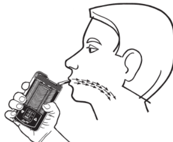
ΕΦΑΡΜΟΓΗ ΤΟΥ ΑΤΜΟΠΟΙΗΤΗ MIGHTY+ MEDIC