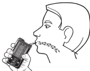
ΕΦΑΡΜΟΓΗ ΤΟΥ ΑΤΜΟΠΟΙΗΤΗ MIGHTY+ MEDIC

Για λεπτομερείς οδηγίες χρήσης της συσκευής, ανατρέξτε στις εσώκλειστες οδηγίες χρήσης που υπάρχουν στη συσκευή MIGHTY+ MEDIC.