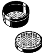
ΚΑΨΟΥΛΑ ΔΟΣΟΛΟΓΙΑΣ ΜΕ ΑΠΟΣΠΩΜΕΝΟ ΚΑΠΑΚΙ

ΣΗΜΕΙΩΣΗ: Οι κάψουλες δοσολογίας είναι αναλώσιμα, που πρέπει να απορριφθούν στα οικιακά απορρίμματα μετά τη χρήση τους.